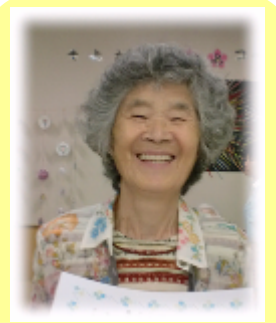
秋の くびっさりの笑顔♡

デイサービスセン ター丸子の里の介護 やサービスについて 皆様からのご意見・ご 要望をお待ちしてお ります。